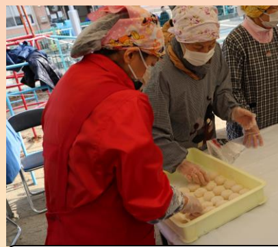
手早くちぎって丸めていきます