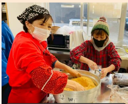
“きなこ” もおいしくできました