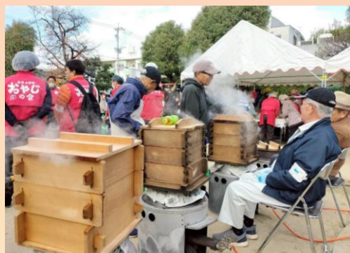
火加減が大切です

こうした大きな行事が開催できるのも、準備から当日の運営まで力を貸して下さる皆様のおかげです。商工店会、女性の会、ソフトボール同好会の皆様をはじめ、春日小学校おやじの会、春日中学校の部伍会、そして地域のボランティアの方々など、総勢100名近くの方が早朝からご協力くださいました。この場を借りて、心より感謝申し上げます。