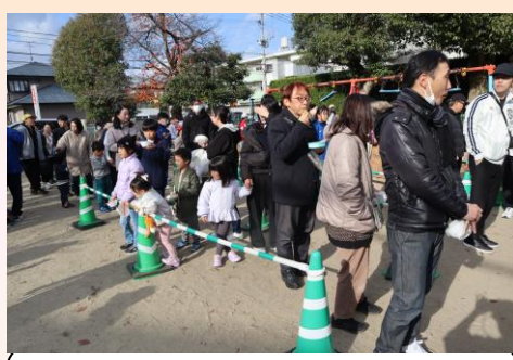
どの味付けにも長い列ができました