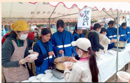
あったかくて、あまーい♡ “ぜんざい” も大人気でした