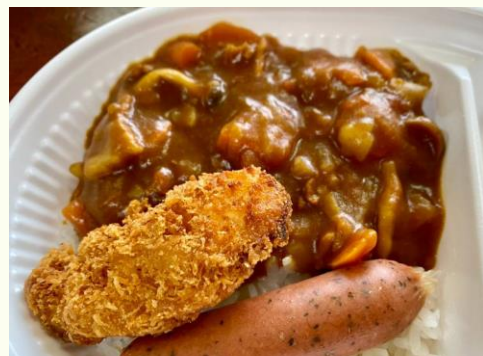
前回のお弁当パントリーのメニュー

なお、コロナ感染予防対策のため、必ずマスク着用、黙食をお願いしておりますので、ご協力ください。