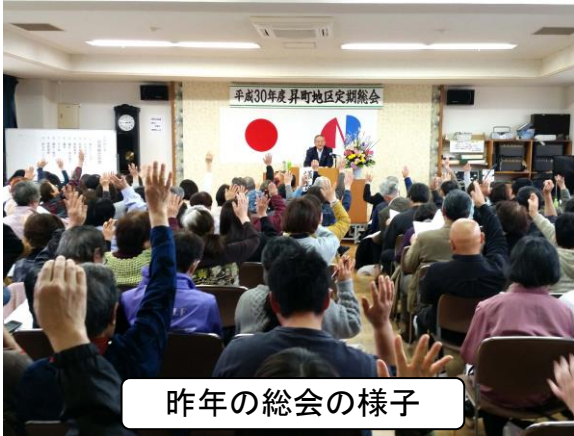
昨年の総会の様子