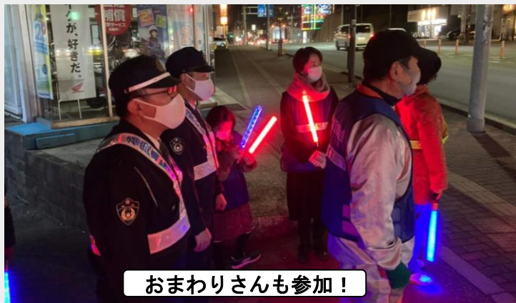
おまわりさんも参加！