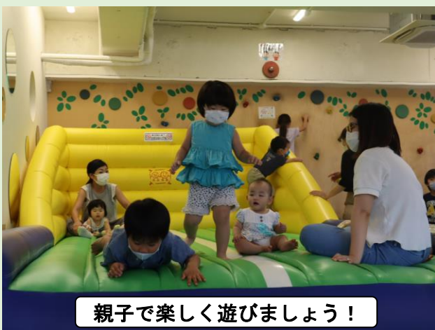
親子で楽しく遊びましょう！

お母さんと未就園児の子どもを対象に平成27年にスタートした「ぽぴーくらぶ」ですが、今年度は、新型コロナ感染防止対策に気を付けながらの実施となりました。