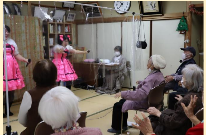
でこぼこボーカルユニット「さくらもち」のお芝居！

また、閉じこもりになりがちな生活の予防や、新しい仲間との出会いもありますので、お気軽にご参加ください。