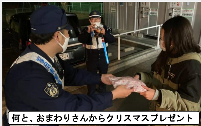
何と、おまわりさんからクリスマスプレゼント