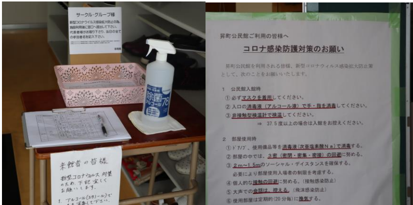
入口に設置したアルコール消毒液と来館者名簿